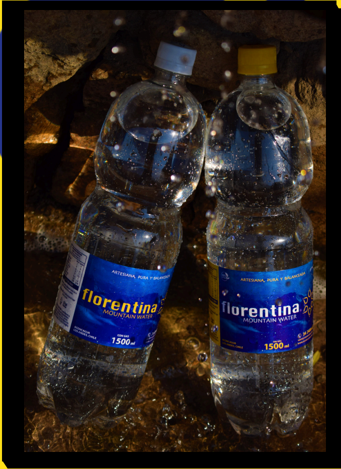
1500ml con y sin gas