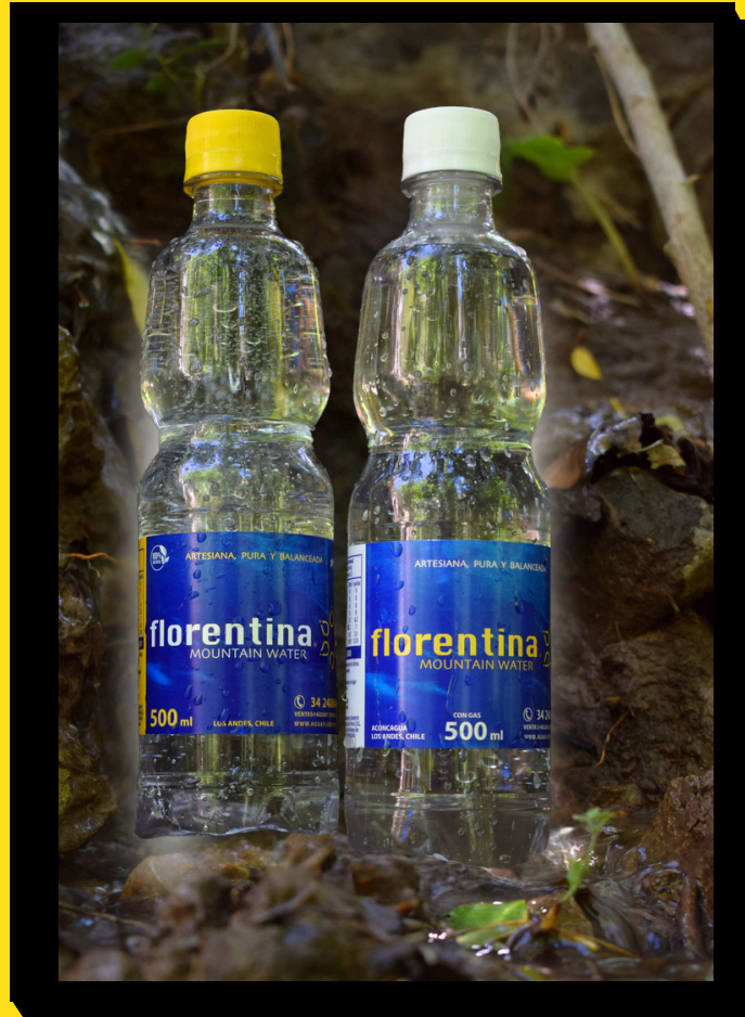
500ml con y sin gas